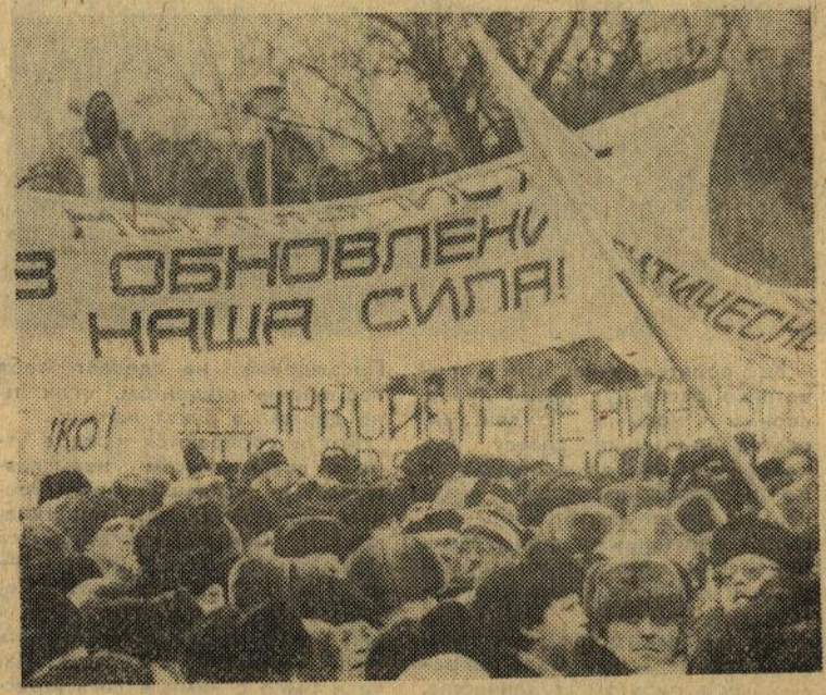
НА СНИМКЕ: один из омских митингов.

Конечно, КПСС неоднородна. Подавляющее число рядовых членов, конечно, не принимало участия в принятии решений, которые завели страну в тупик. Конечно, им была отведена роль статистов в партийных играх. Но ведь мы — рядовые члены — действовали в «свете решений»? Но ведь одобряли и по крайней мере не возражали? Ведь участвовали в так называемых соцсоревнованиях, многочисленных «битвах» за урожай и еще что-то, изучении трилогий и произведений прочих классиков и в тысячах других малых и больших дел, полных бессмыслицы и насилия над здравым смыслом? И кроме того, добровольно отдав партократии пра-