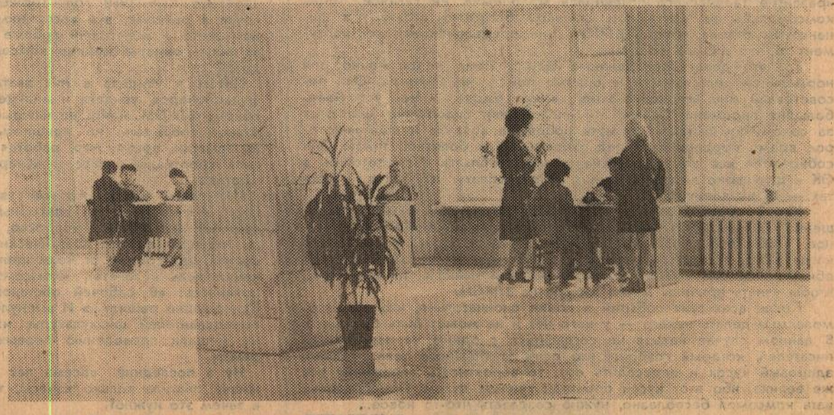
НА СНИМКЕ: это наша история — первый день работы приемной комиссии ОмГУ в июне 1974 г.

В «Дружбе» есть популярная рубрика «Задайте вопрос. Победителям — автограф!». Читатели задавали вопросы Раймонду Палу, Людмиле Гурченко, Джуне Давиташвили, Михаилу Боярскому, Владимиру Кузьмину. Авторы лучших вопросов удаивались автограф «звезд». В 1991 году эта рубрика будет продолжена. Подписаться на журнал «Дружба» можно в любом отделении связи. Подписной индекс — 70258, цена 7 руб. 20 коп.