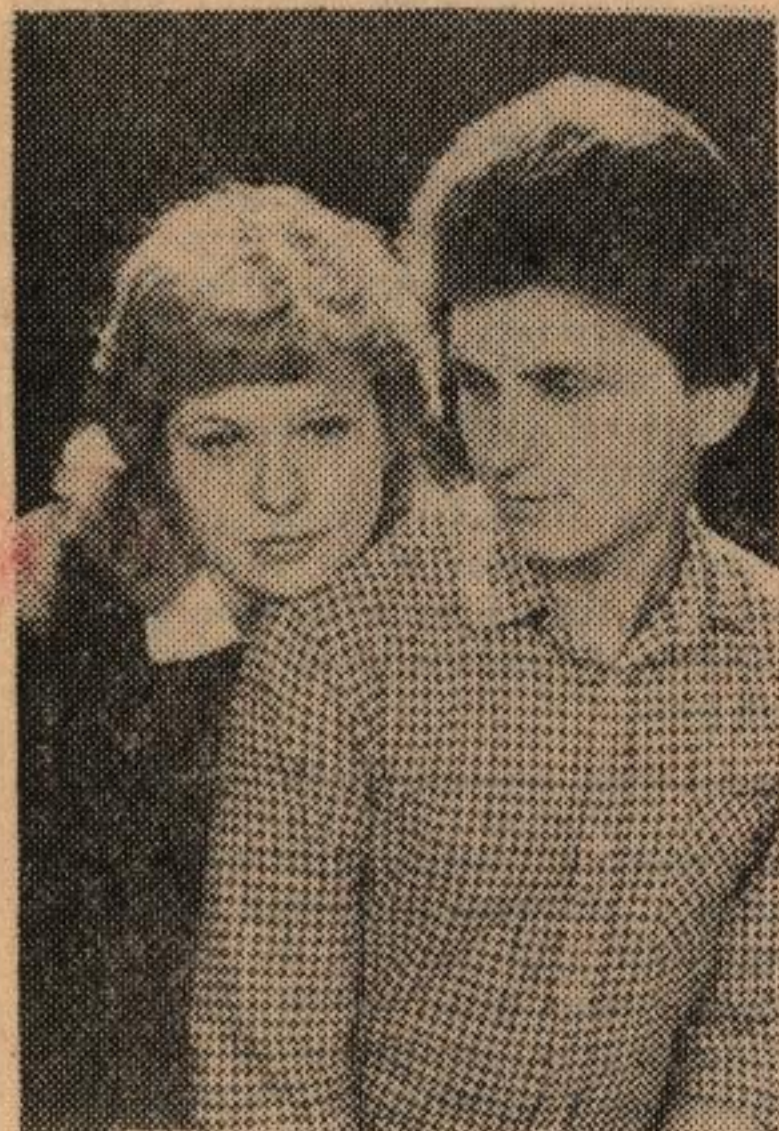
КАК ЖИВЕШЬ, ВЫПУСКНИК?

ОРГАН ПАРТКОМА, РЕКТОРАТА, КОМИТЕТА ВЛКСМ, ПРОФСОЮЗНЫХ КОМИТЕТОВ ОМСКОГО ПОЛИТЕХНИЧЕСКОГО ИНСТИТУТА.