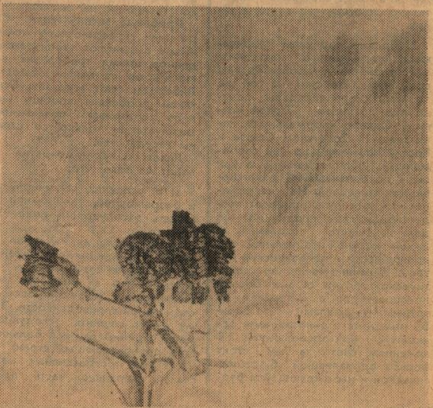
«Сибирская зима».