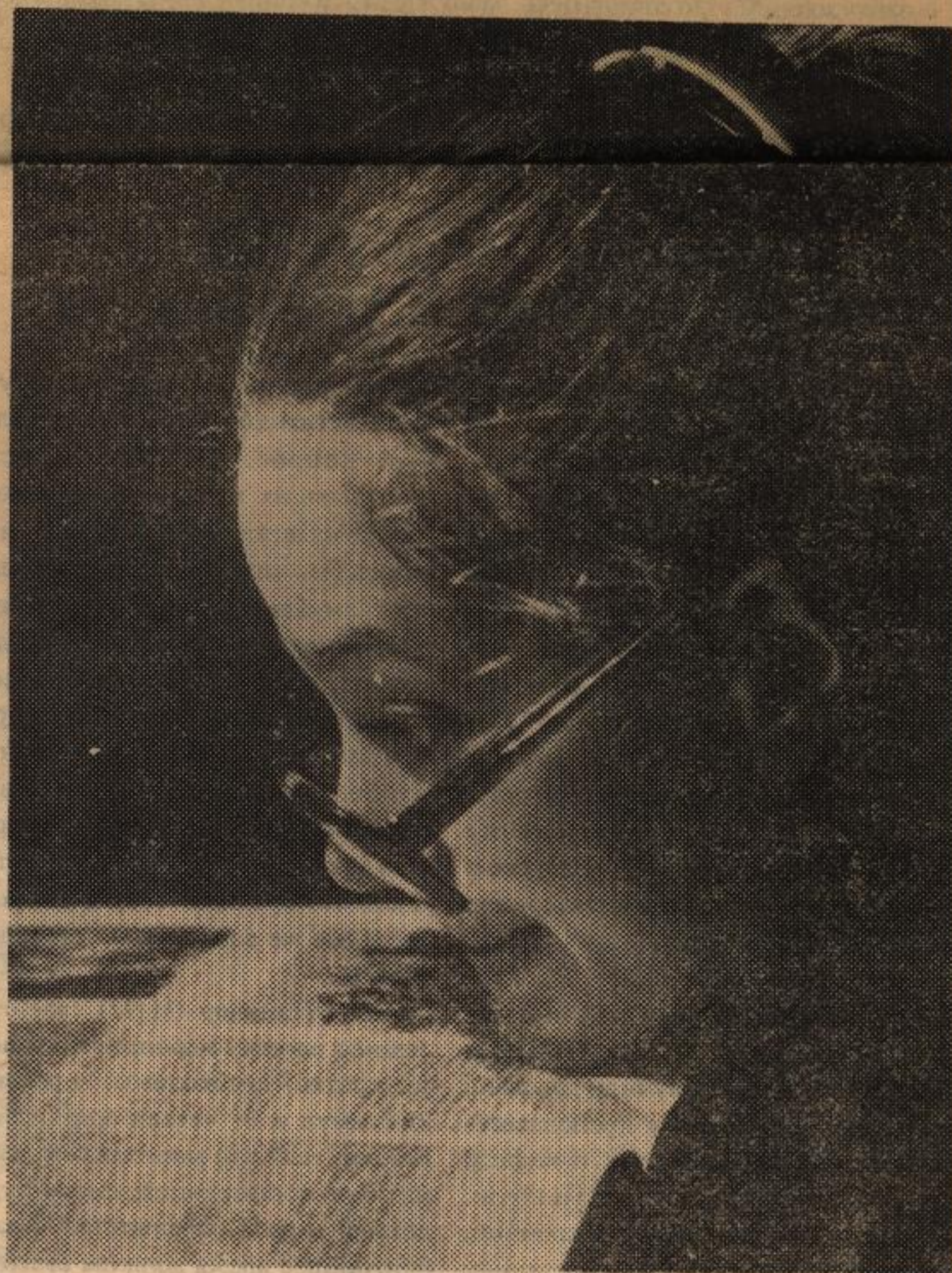
На снимке: заучилась...