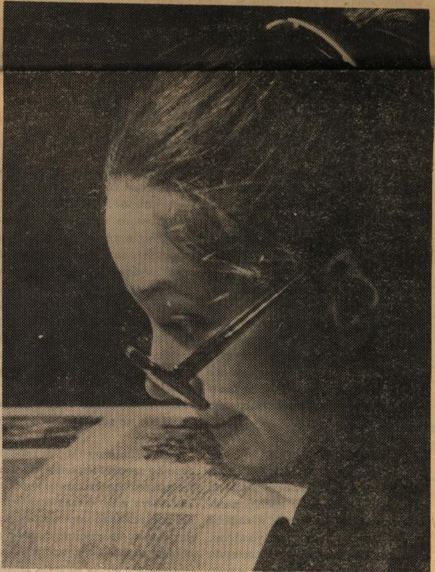
На снимке: заучилась...