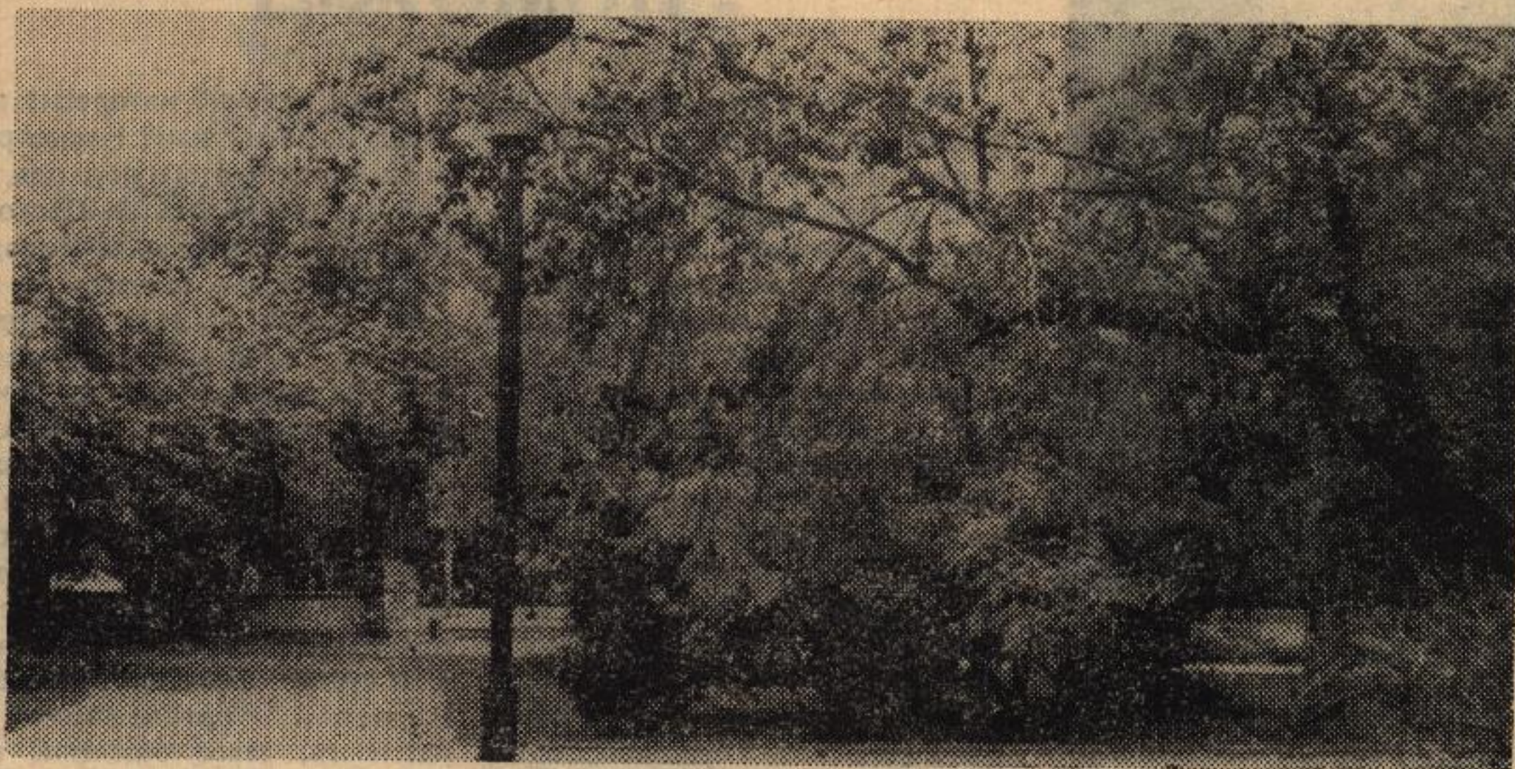
Осень в городе.

В предыдущем номере мы обещали читателям продолжить разговор о проблемах нашей многострадальной культуры. И так получилось, что весь сегодняшний номер так или иначе касается культуры. Это и разговор о критериях нашей образованности. И результаты различных опросов по выявлению нашего культурного уровня. И художественное творчество наших студентов. И наблюдения наших преподавателей (побывавших за границей и не побывавших). И многое другое.