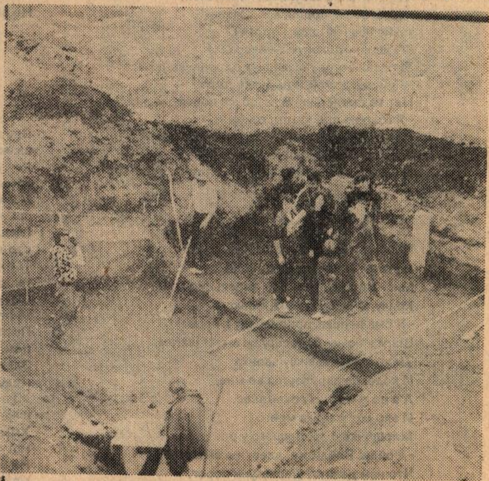
На снимке: студенты-археологи на раскопе.