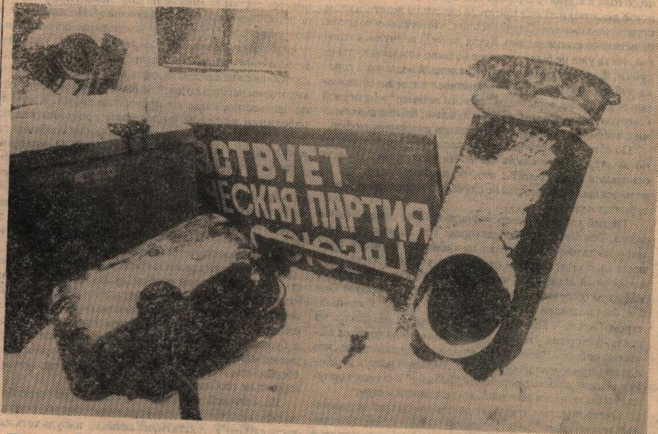
Прогноз был еще новогодним...

Счастья вам, дорогие юбиляры! Творческих и всевозможных других успехов!