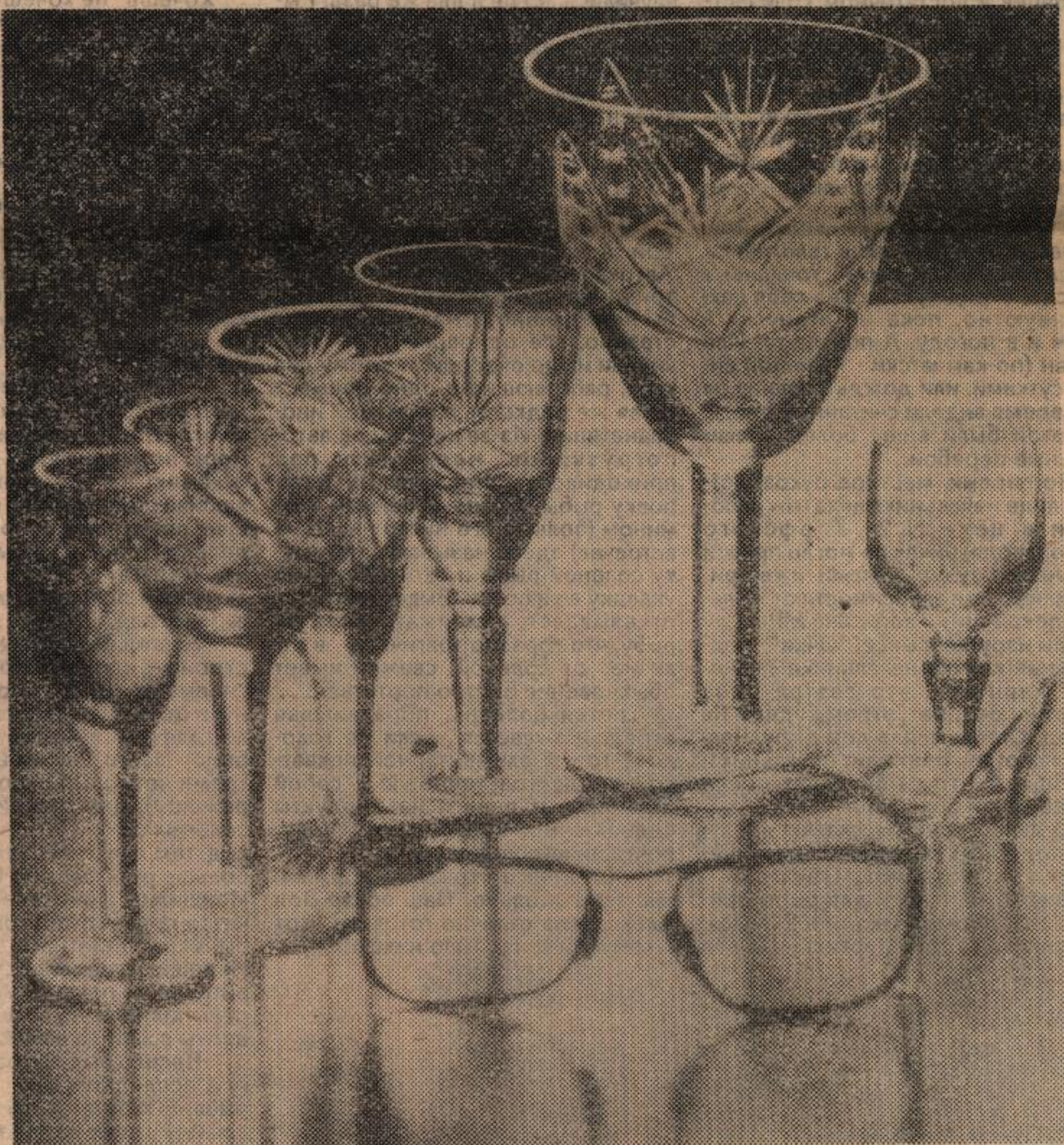
Похвальное слово стеклу.