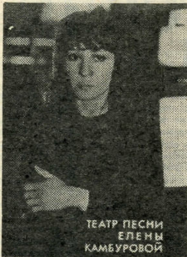
ТЕАТР ПЕСНИ ЕЛЕНА КАМБУРОВОЙ