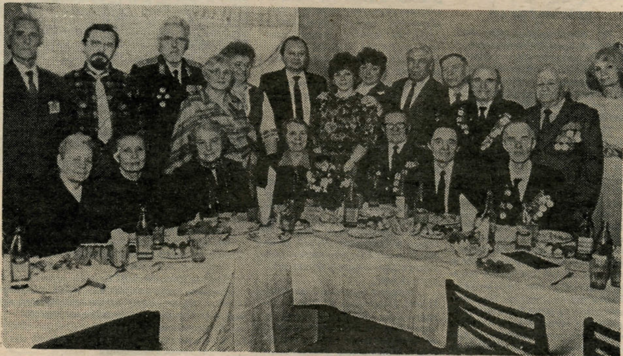
На снимке: так чествовали ветеранов войны и труда ОмГУ 7-го мая.