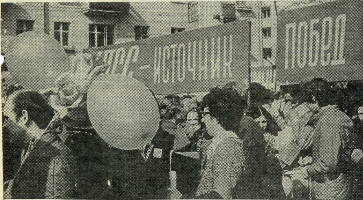
Из недавнего прошлого.