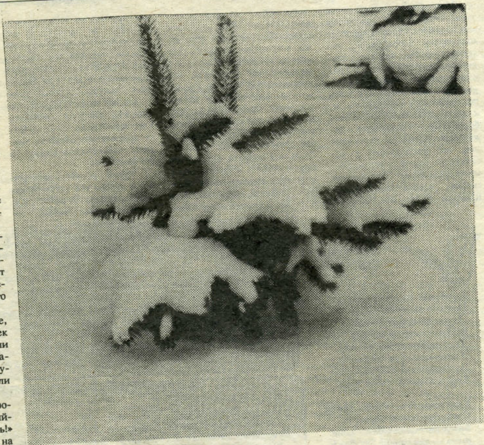
В лесу родилась елочка...

* Сложкой еды идут за ворота и приговаривают: «Суженый-ряженый, приходи кисель есть!» Если кто-нибудь встретится на улице, нужно спросить его имя — так будут звать экзаменатора.