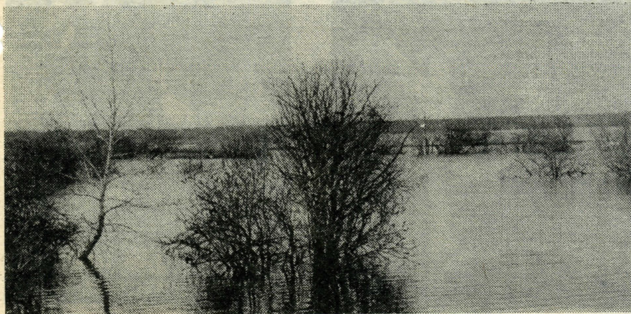
Весенний фотозъезд.