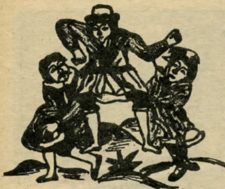
Фёма, Паранюшка и Ерёма (Лубок XVIII в.)