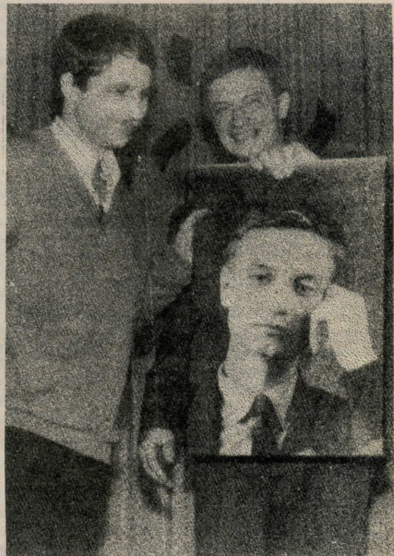
Раз ковбой, два ковбой...