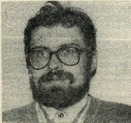
Знай начальство в лицо!

- О, прокуратура тема особая. По меньшей мере до конца второго курса мечтал стать не кем-нибудь, а Генеральным Прокурором РФ. Думал, что он может реально способствовать утверждению в стране законности и справедливости, но после событий 1993-го года и особенно отставки А.И.Казанника стало ясно, что выполнять требования главы нашего государства без нарушения закона нельзя. Я оставил подобные замыслы. Для меня важнейший принцип работы «закон нужно защищать и уважать». Просто убивает, когда некоторые коллеги заявляют, что обучаются юриспруденции ради умения этот закон обойти! Я так поступать не могу, совесть, извините, с потрохами сожрет. Правда, порядочность вместе с совестью объявлены сейчас пережитками прошлого. Только верно ли это? Сомневаюсь... В коммерческой конторе юрист, говоря откровенно, всегда находится «под руководителем». Он должен обеспечить «законность» действий директора