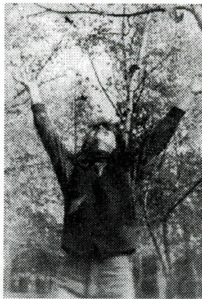
Приходи, весна!

Студенческий билет № 97313, выданный ОмГУ на имя Янчицкого Кирилла Александровича (Я-71), считать недействительным.