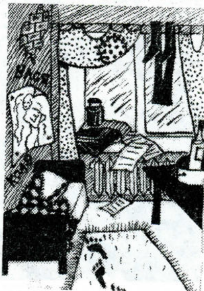
Рис. Ю. Радзиевской.

приходят, да и хулиганят меньше, вроде как и разговора нет. Конечно, обо всех однозначно судить нельзя, но закономерность кое-какая прослеживается.