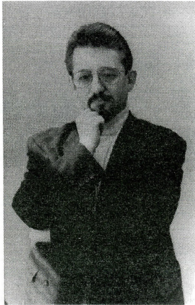
Представляем кандидата в депутаты

Кстати, полезно вспомнить, что в 50-е годы было две компьютерные державы - США и СССР, первый в мире язык программирования создан А.А.Ляпуновым, а один из первых компьютеров - С.А.Лебедевым, но в 70-е годы Брежневское руководство приняло решение прекратить собственные разработки в этой области и копировать американские (известная серия ЕС ЭВМ)... Вот теперь и покупаем компьютеры даже в Малайзии. Я считаю, что это была первая крупнейшая