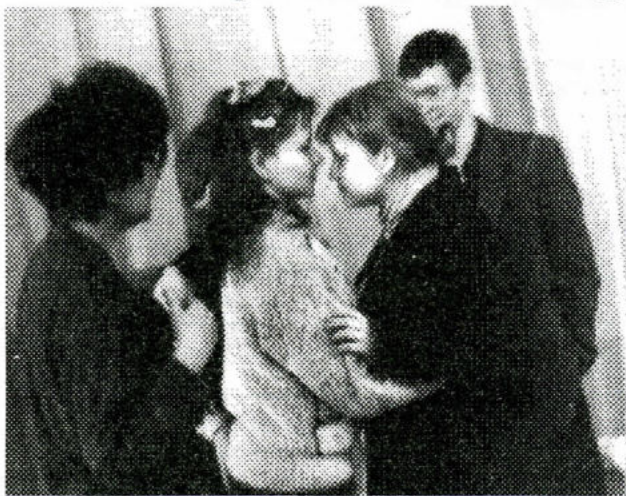
В "Поиске" премьера