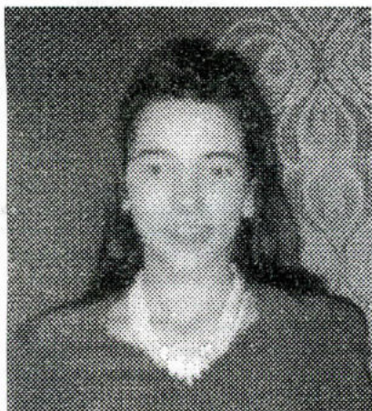
Кем мы гордимся