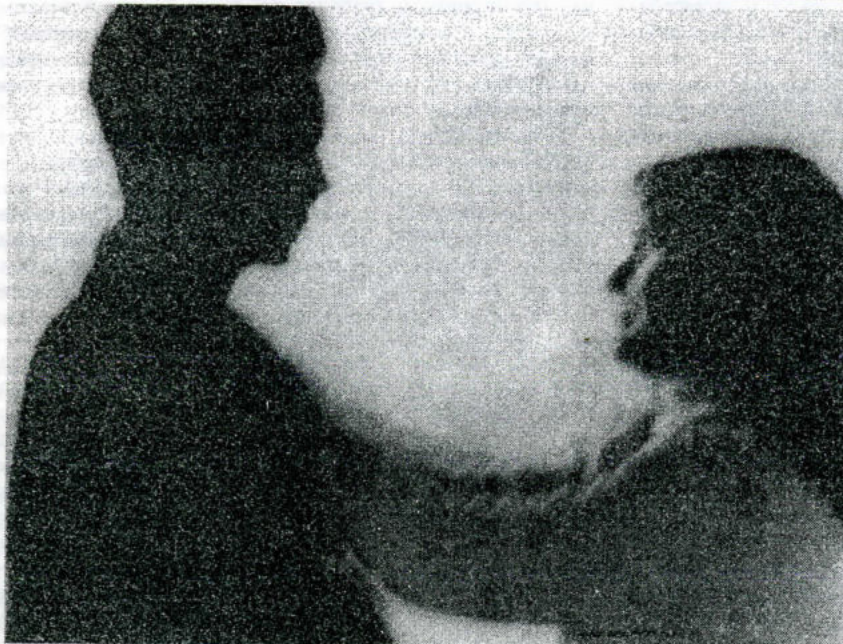
С днем святого Валентина!

ОРГАН СОВЕТА ОМСКОГО ГОСУДАРСТВЕННОГО УНИВЕРСИТЕТА ☆ №3 (362) ☆ 9 февраля 2001 г. ☆ Цена 50 коп.