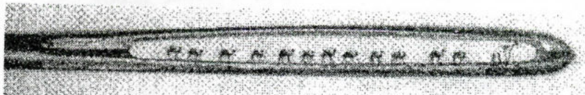
Караван верблюдов в ушке иголки. Высота верблюдов, выполненных из золота, 0,25 мм.