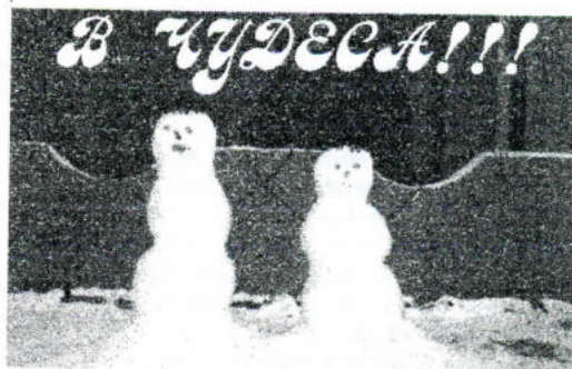
Наталья Лазарева.