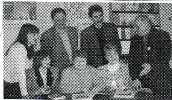
На снимке: редакционная комиссия журнала «Культурологические исследования в Сибири».