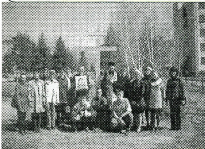
25 января - Татьянин день

ОРГАН СОВЕТА ОМСКОГО ГОСУДАРСТВЕННОГО УНИВЕРСИТЕТА ☆ №2 (430) ☆ 24 января 2003 г. ☆ Цена 50 коп.