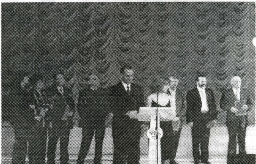
Награждение преподавателей, проработавших на факультете более 25 лет.