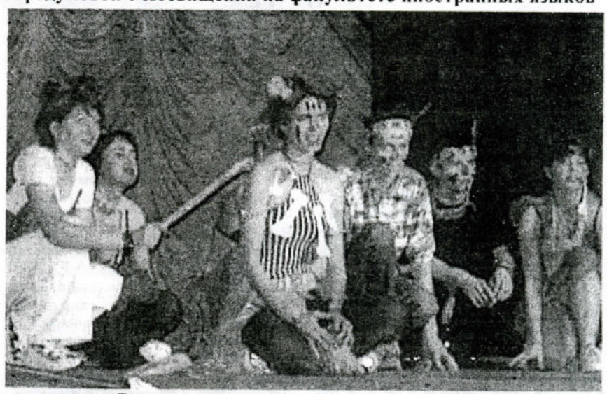
Дикари с острова в исполнении студентов факультета иностранных языков

Первокурсники решили, что их спасет ответ «Нас кто-то заколотил в кабинке туалета», но и тут ошиблись, потому что старшекурсники в это время «заколачивали дверь в туалет». Таким образом ревизор узнал, как определяют тех, кто достоин учиться на факультете. Но еще нужно ознакомиться и с работой преподавательского состава, особенно в экстремальных условиях. Например, на острове с дикарями, у которых нужно забрать бананы (см. фото на первой странице). Сделать это им, ко-