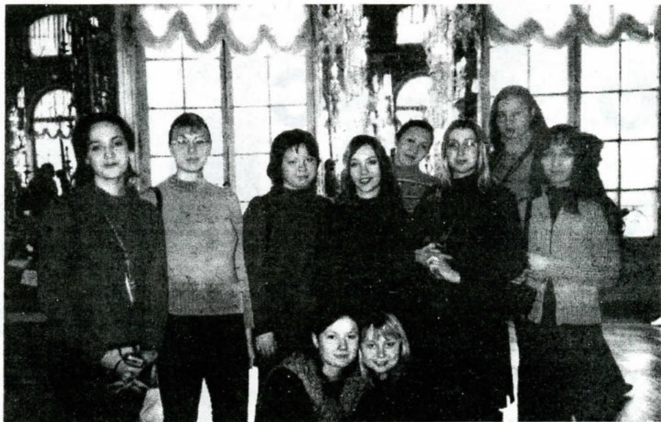
Студенты группы ИМ-001 на практике в Санкт-Петербурге

Непосредственно сама музейная практика проходила в Российском этнографическом музее (РЭМ), где мы, работая в различных фондах, познакомились со спецификой музейной работы. Кроме этого мы прослушали в РЭМ лекции доктора культуроло-