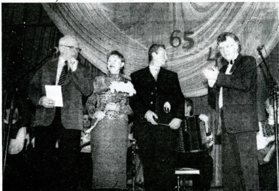
Виктор Николаевич Киселев принимает поздравления.

В минувшую субботу в Доме актёра имени Н. Чонишвили прошёл юбилейный концерт известного омского композитора Виктора Киселёва. Вообще говоря, это был дважды юбилейный концерт, поскольку он посвящён 65-летию музыканта и 45-летию его творческой и педагогической деятельности. Слушатели были буквально поражены всем, что происходило на сцене, и было от чего. Далеко не каждый день можно услышать столько замечательных голосов - ведь песни Виктора Киселёва поют такие звёзды, как солисты Омского государственного музы-