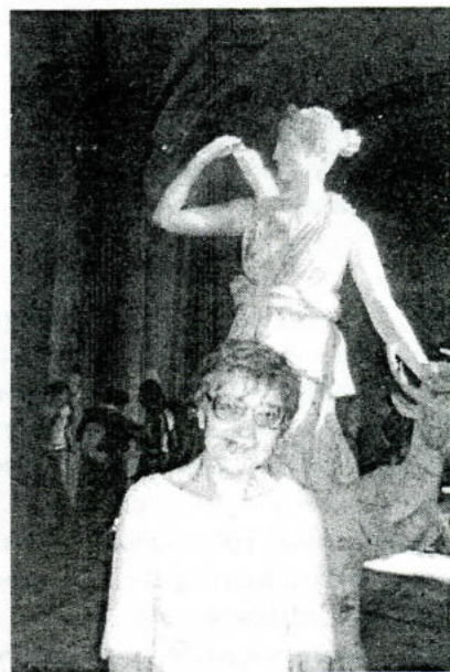
Лувр: возле статуи Артемиды

Еще одна всемирно известная парижанка уже вторую сотню лет носит фамилию Эйфелева. Вид с ее второго яруса на ночной Париж (есть и такая экскурсия) нужно видеть: как нарочно, в круговой панорамы – вся знаменитая архитектура столицы мира, сияющая подсветками. Этой башни, ненавидимой многими во время создания, трудно представить теперь этот город. Кстати, когда-то дамы в кринолинах и их кавалеры в смокингах, желающие увидеть Па-