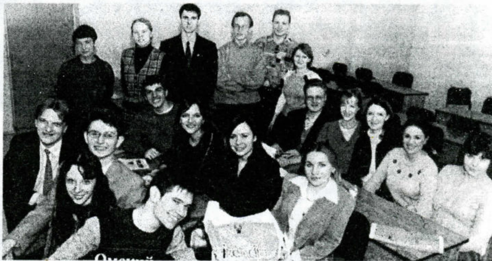
Победители конкурса на получение Федеральной стипендии В.Потанина 2003-2004 учебного года (ОмГУ)