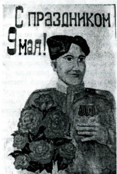
Один из плакатов, которыми встречали ветеранов в фойе у актового зала I корпуса

Вот и отгремели праздничные салюты, посвященные 60-летию Победы. Страна долго готовилась отметить эту дату. Газеты писали о фронтовиках, проходили различные с ними встречи. Поздравил своих ветеранов и наш университет.