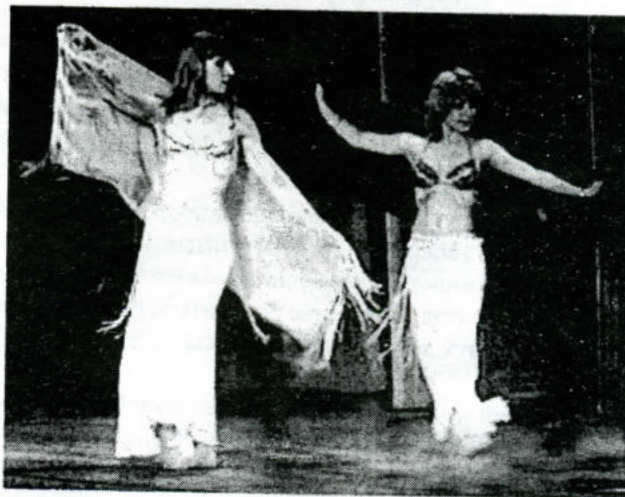
Арабские танцы первокурсниц химфака

Если импровизация на сцене порой ребятам не совсем удавалась, а где-то чувствовалось, что не хва-