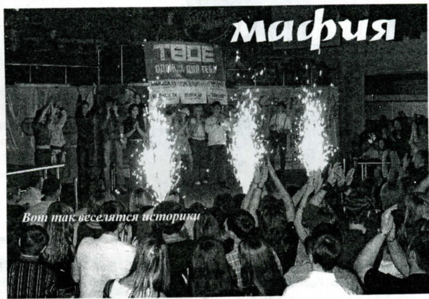
Вот так веселятся историки

А еще первокурсников предупредили о том, что преподаватели иногда говорят на лекциях весьма забавные вещи: «Солдаты стали громить дома терпимости, но скоро