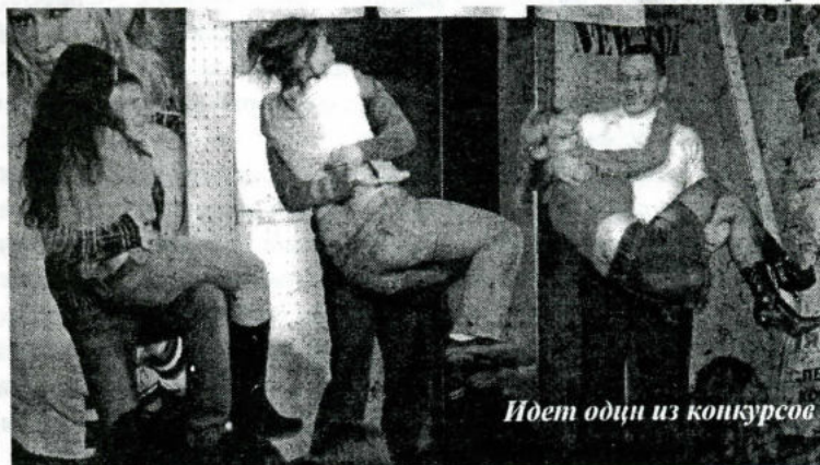
Идет один из конкурсов

2 декабря 2005 года состоится V шахматный турнир памяти А.И.Петрова. Открытие в 14 часов в помещении столовой II корпуса. Регистрация участников с 12.30 до 13.40.