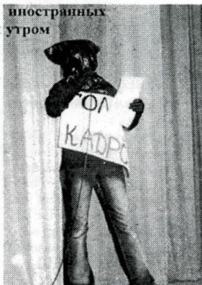
Вот такой он - голос за кадром!