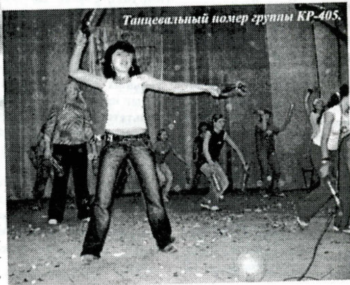
Танцевальный номер группы КР-405.