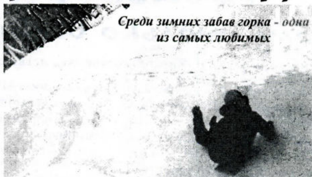
Среди зимних забав горка - одна из самых любимых

Особо хотелось бы рассказать о горке, которая находилась совсем близко от корпуса. Она очень высокая и крутая. Кто хоть раз прокатился с нее, не забудет свои ощущения. Но вообще-то хотелось кататься и кататься. Пока мы занимались активным отдыхом, наступало время обеда, приходилось прекращать увлекательные занятия и идти в уютную теплую столовую, чтобы подзарядиться энергией до ужина. А она нам была нужна, так как впереди бассейн и сауна. Как приятно погреться, а затем нырнуть в прохладную