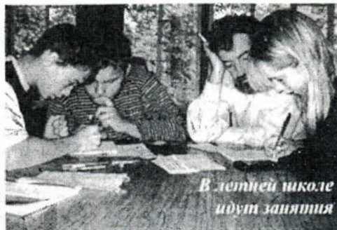
В летней школе идут занятия

В июне буду в городе, в июле - у бабушки в деревне, а в августе, конечно же, поеду в Летнюю школу. Я пойду в физико-математическую