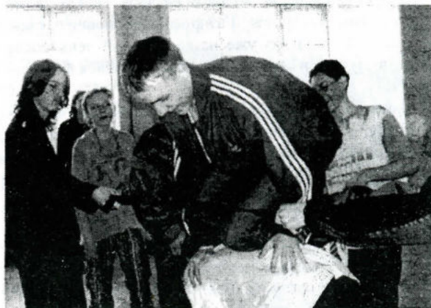
Чего только не вынесут плечи товарища!

Несмотря на напряженную игру, знатоки-квншники все-таки выиграли. Победу им принес ответ на