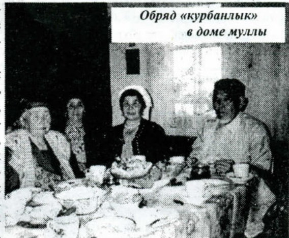
Обряд «курбанлык» в доме муллы

ные наши сотоварищи, отправившись в финале экспедиции, в рейд по татарским деревням, расположенным в районе озера Большой Уват. Любая техника быстро «умирает», не доезжая до здешних мест, несмотря на то, что составленная провокаторами-географами карта обозначает местную трассу как «дорогу с улучшенным покрытием». Из подручных средств местное население монтирует странные сюрреалистические средства передвижения, именуемые болотоходами, и только лишь благодаря им получает возможность передвижения по окружающим Большой Уват заболоченным пустошам. Оторванные от цивилизации сельские жители живут здесь как на острове, занимаясь охотой, рыболовством, разнообразными ежедневными деревенскими делами. Впрочем, оторванность от мира до-