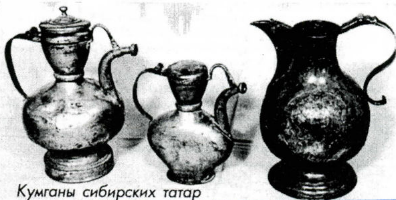
Кумганы сибирских татар

Музей работает: понедельник - 10.00-16.00; вторник - 10.00-13.00; среда - 14.00-16.00; четверг - 10.00-16.00; пятница - 10.00-13.00.