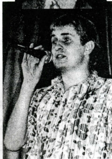
На снимке: бенефициант и его портрет: найди десять отличий.