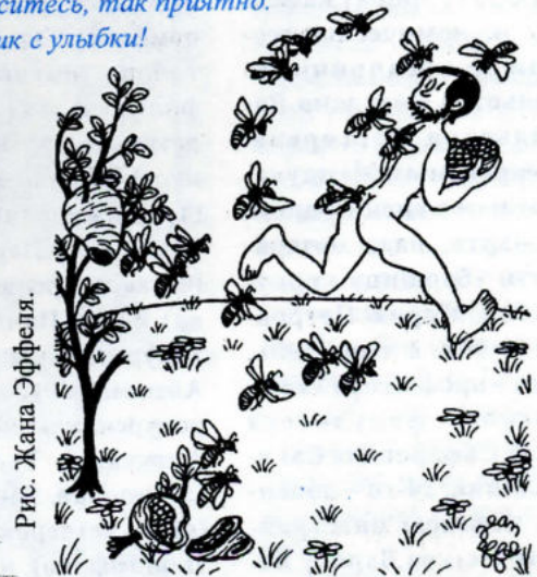
Рис. Жана Эффеля.

8 Марта. Мужчина со времен Адама жертвует собой ради подарка.