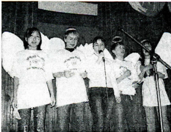
Отряд естественных наук на Театрально-музыкальном конкурсе