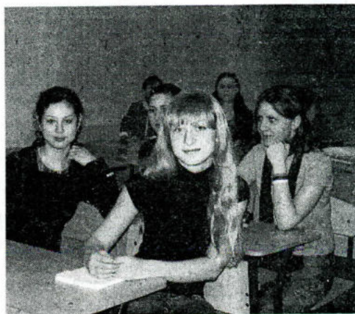
В «Аэлите» можно не только отдыхать, но и учиться.

Далее выступала команда... ПТУ. Да, да! Я не ошиблась. Название расшифровывается как Просто Так Уж Получилось (ведь все команды были организованы методом слепой жеребьевки) Кстати, во время той самой жеребьевки произошло абсолютно мистическое событие: в команде под номером три собрались почти все студенты группы ЛМ-404. То ли жеребьевка была не совсем слепой, то ли ЛМ-404 и впрямь неразделима. Не случайно их девиз - «Один за всех и все за одного!». А назвать решили просто - «ЛМ». Что, как выяснилось, означает «Люблю Мир». Команда