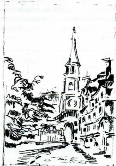
Burlington Church street

Америка – страна толстяков. Может быть, об этом говорит статистика, но на улицах этого точно не заметно. Наоборот, сначала удивляет количество занимающихся спортом людей – часов с семи утра на