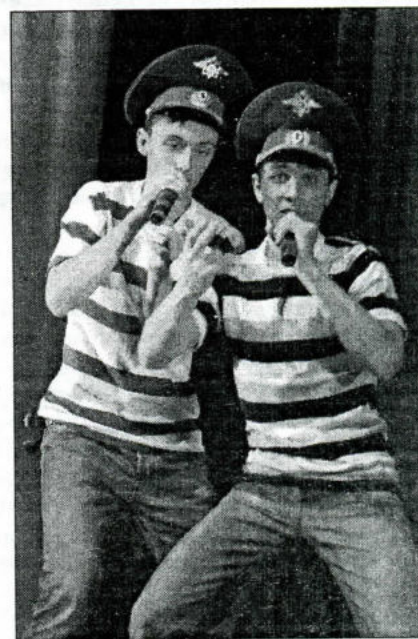
Выступает команда «Шинель № 5» (академия МВД).

А потом пришла очередь команд, которые подготовились более качественно. Излучшего: президент Медведев у телевизора, обреченный весь вечер наблюдать свою вчерашнюю встречу с