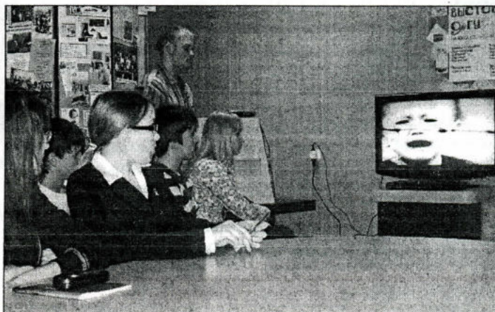
На снимке: студенты смотрят фильм о лагере для жен репрессированных.