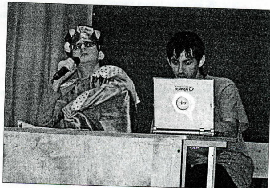
Выступает команда «Рутинные истории».