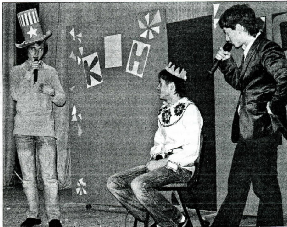
Выступает команда «Чернослив».