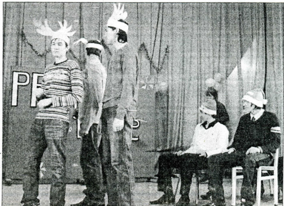
Оленями и Санта-Клаусами притворялись студенты из команды «Microchips» (ФКН).