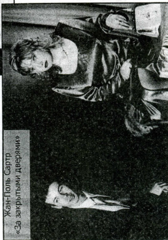
Жан-Поль Сартр «За закрытыми дверями»